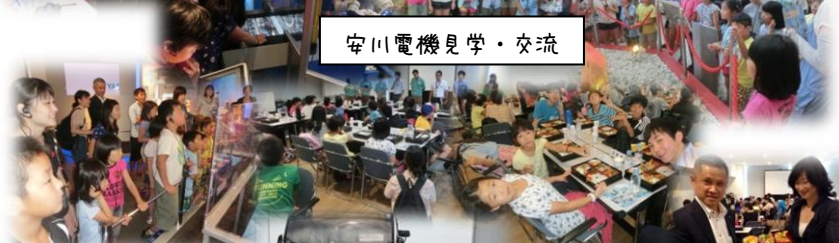
安川電機見学・交流