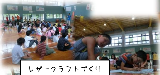
レザークラフトづくり