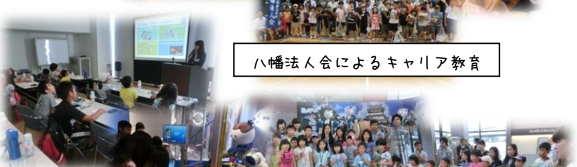
八幡法人会によるキャリア教育