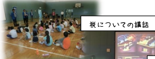
萩についての講話