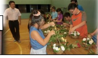
フラワーアレンジメント体験